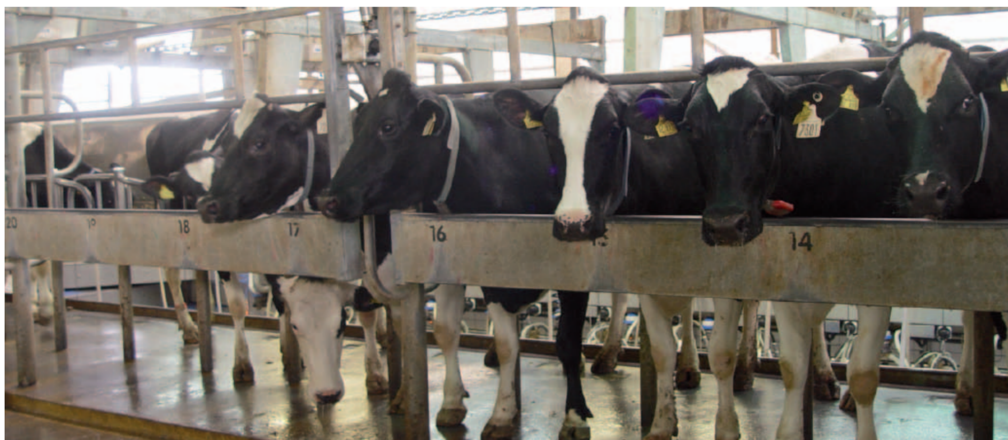
Befüllung des Melkstandes

Anschließend folgt das Vormelken der Tiere, um eventuelle Verunreinigungen aus dem Strichkanal zu entfernen und dann die Reinigung mit einem sauberen Tuch (jede Kuh eins). Dies alles bewirkt bei der Kuh eine Oxitocin-ausschüttung. Nun ist sie bereit ihre Milch loszulassen, das Melkzeug wird angesetzt und die Milch fließt in den Milchtank. Nach etwa 5 Minuten versiegt der Milchstrom, das Vakuum wird abgeschaltet und die Melkzeuge werden automatisch abgenommen. Um den Strichkanal zu verschließen werden die Zitzen gedippt. Der Melker kontrolliert nochmals die Euter und dann entlässt der Melker durch Drehung der vorderen Sperre die Tiere, FERTIG.